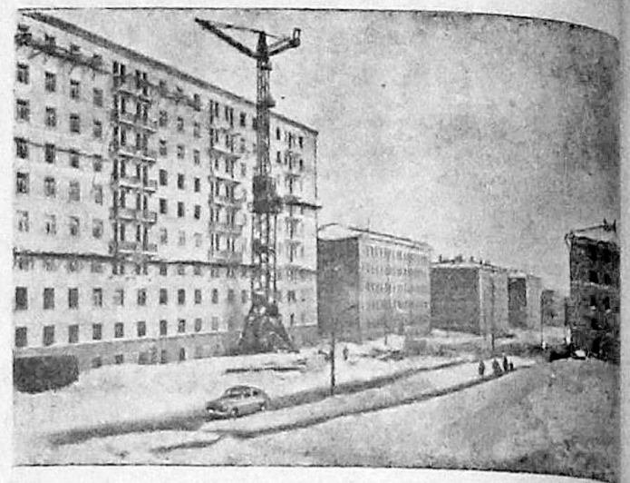
Москва сегодня. Строительство жилых домов на 5-й Черемушкинской улице.

б) Объединенный секретариат, в который входят представители всех государств — участников Варшавского договора.