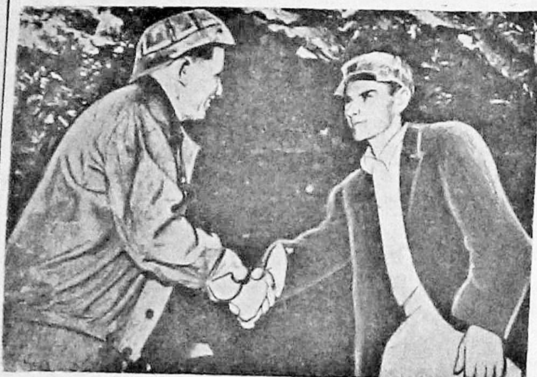
Румынская Народная Республика. Коллектив строителей крупнейшей в стране гидроэлектростанции имени Ленина в Биказе одержал большую производственную победу. На 170 дней раньше срока закончена проходка пятикилометрового тоннеля, по которому воды реки Бистрица пойдут к турбинам станции.

«В декабре 1955 года, — продолжал премьер-министр, — организаторы багдадского пакта мобилизовали все свои усилия на то, чтобы втянуть в него Иорданию. Они были уверены в своем успехе. Но их ожидало разочарование. Иорданский народ оказал сопротивление и не согласился войти в эту большую тюрьму».